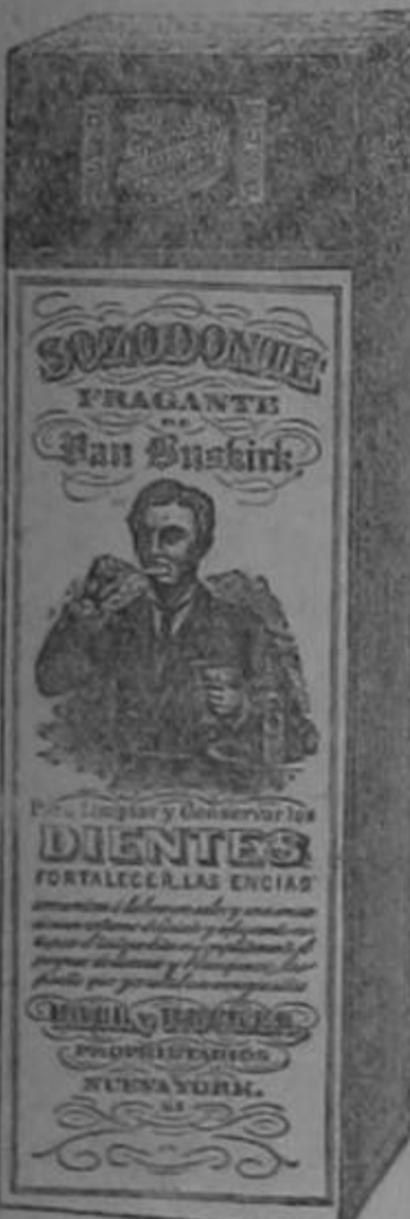
Esta es la figura exacta del paquete segun se vende.

215 Washington St., New York, EE. UU. de A.